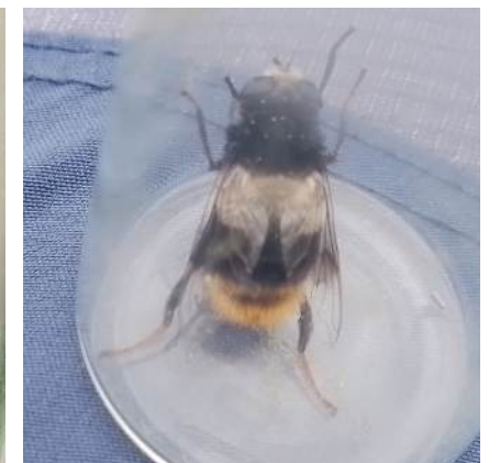
Prakt droneflue

Rødknappsandbie (CR): Et godt år for arten i Aust-Agder med funn i samtlige fem kommuner der arten er påvist også tidligere, inklusive på en ny lokalitet i Arendal kommune langt unna andre av artens kjente lokaliteter. I Telemark kun gjenfunn i Kammerfoss-området i Kragerø kommune, og ingen funn i Vestfold. Dette til tross for mange fine habitater for arten også i disse to fylkene.