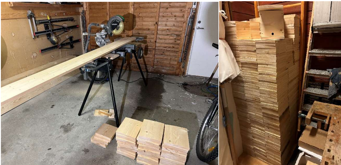
Kapping av emner til enkel selvbygger-humlekasse, desember 2023

De to prosjektene med tilskudd fra Trondheim kommunes klimamillion, Humleundervisningsmateriell og Humlekassebygging, har startet med innkjøp. På førstnevnte har vi supplert humlevandringsmateriellet med 15 håver og 30 glass. Her gjenstår å bruke kr. 2.061,53 på fargetusjer og eventuelt flere håver for at prosjektet skal gå i null. Til humlekassebyggingen har vi kjøpt inn nødvendig bordkledning til de 80 selvbyggerkassene. Disse er nå kappet til og klare for videre bearbeiding, inkludert inngangs og luftehull, fluenetting, og forboring for skruer, mm. Foreløpig er ingenting til de 24 ferdigbygde kassene anskaffet. På dette prosjektet gjenstår å bruke kr. 15.991,02 for at det skal gå i null. Status ble rapportert inne fristen 31. desember. Frist for sluttrapportering er satt til 31. mai.