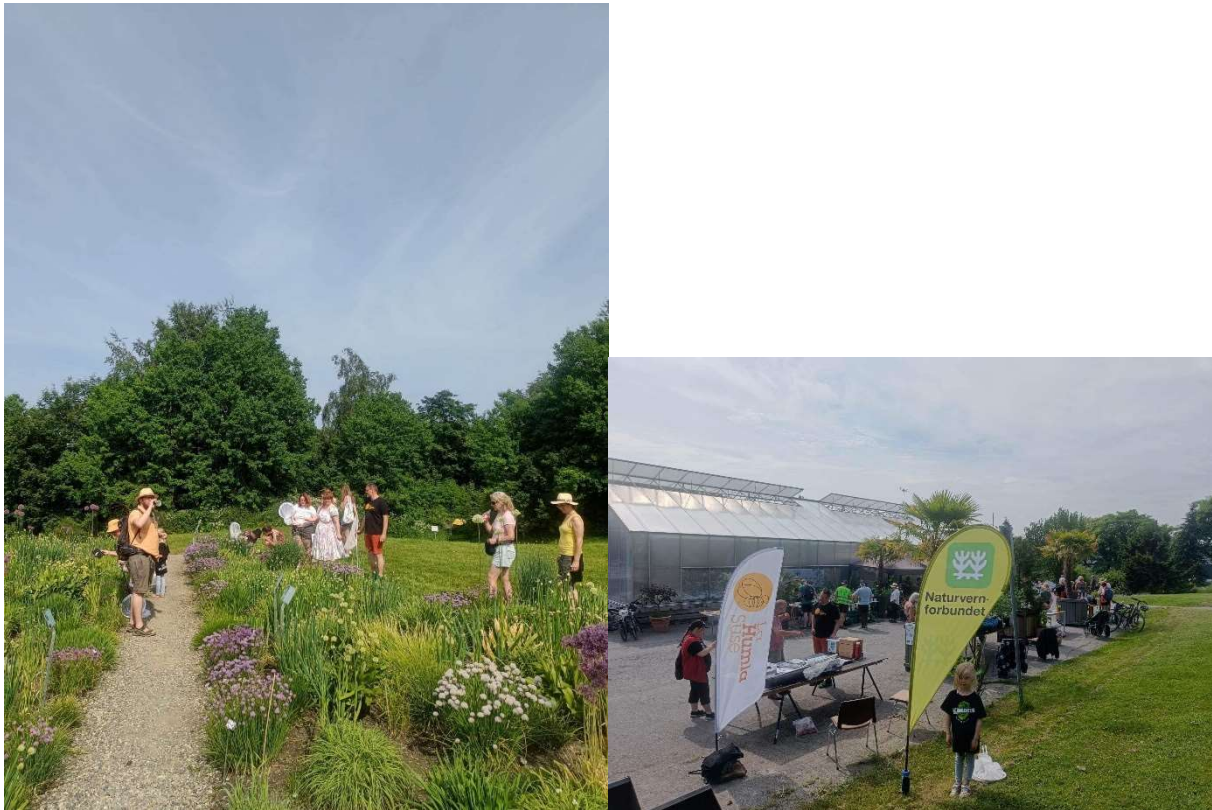
Åpen dag i Ringve botaniske hage, 18. juni 2023