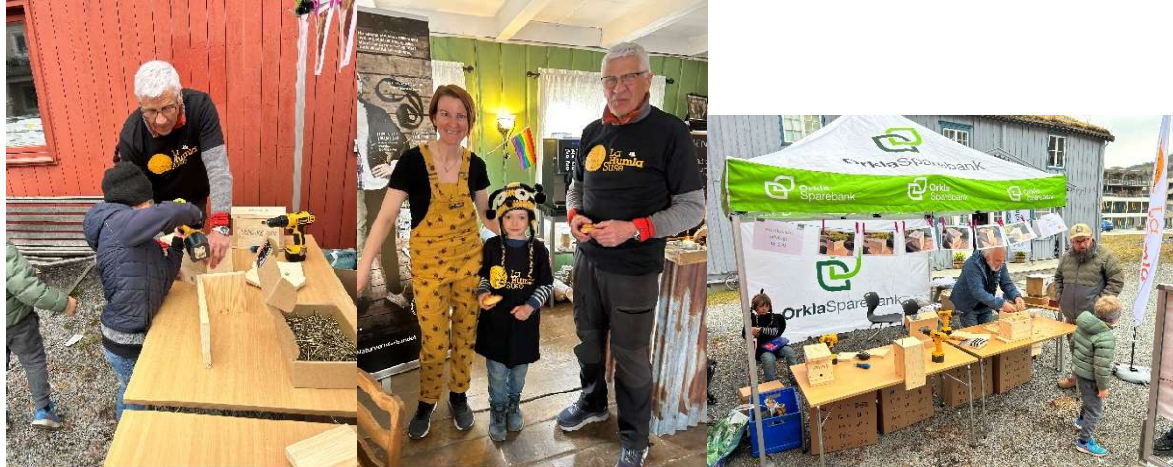
Klesbyttedagen på Orkanger 22. april 2023