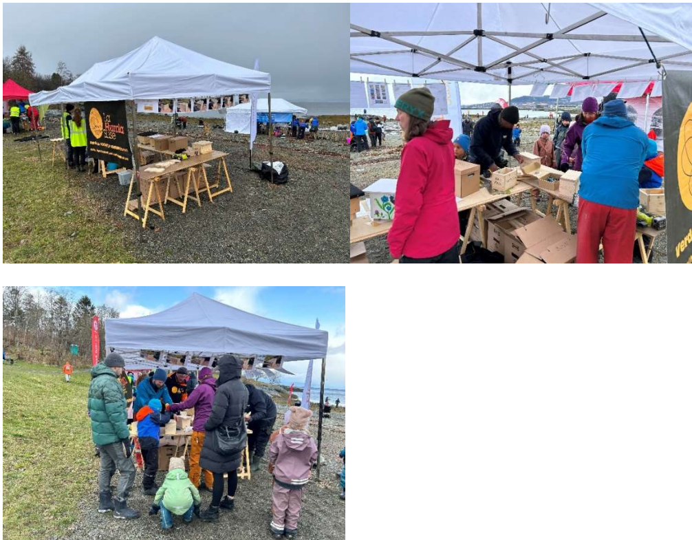
Barnas Store Fjæredag, Rotvollfjæra 30. april 2023