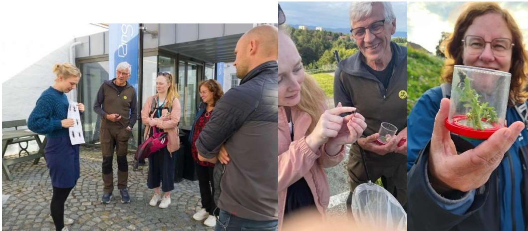
Humlevandring med NINA, Ringve botaniske hage, 7. september 2023