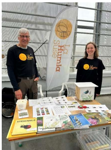
Ringve botaniske hages hagefest, 10. september 2023