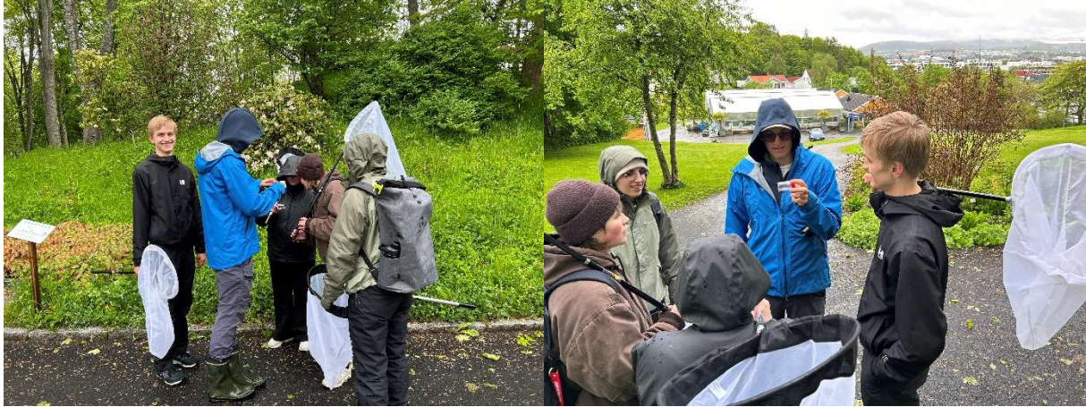
Studenthumlevandring, Ringve botaniske hage, 25. mai 2023