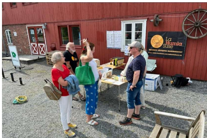
Grønn dag hos Kulturstua Børsen på Orkanger, 18. juni 2023