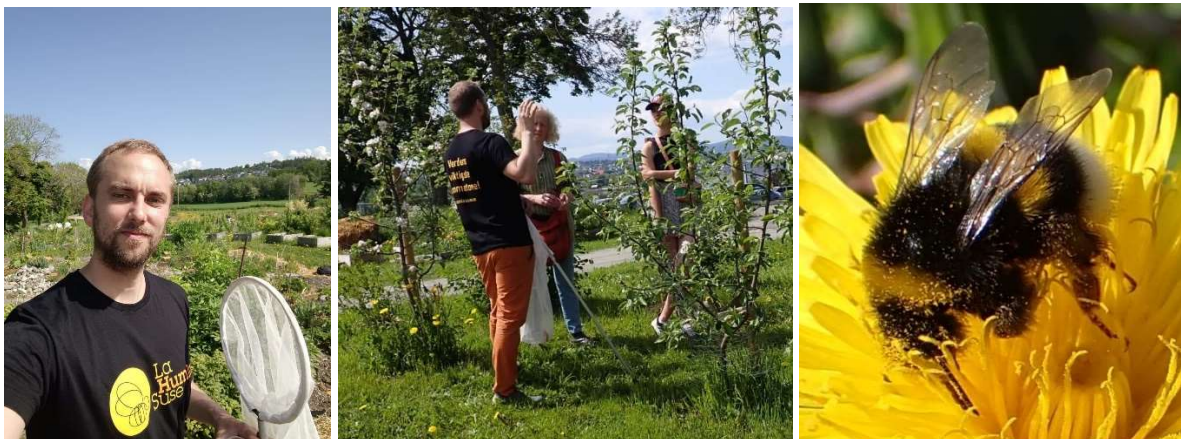
Den ville polinator tellingen, Ringve botaniske hage, 10. juni 2023