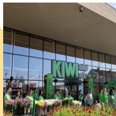
Bilder fra Kiwi Lerberg